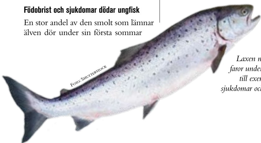
Laxen möter många faror under sin levnad, till exempel fiskare, sjukdomar och miljögifter.

Även miljöföroreningen dioxin, som bland annat bildas vid sopförbränning, orsakar problem. Fet fisk från Östersjöområdet, till exempel vildfångad lax, innehåller ofta dioxinhalter som överskrider EU:s gränsvärden för hur mycket dioxin som maten får innehålla. Dioxin kan bland annat påverka fortplantningsförmågan, hjärnans utveckling och orsaka cancer.