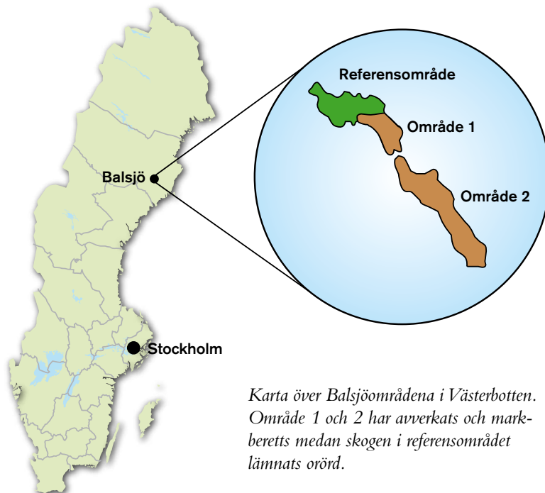
Karta över Balsjöområdena i Västerbotten. Område 1 och 2 har avverkats och markeretts medan skogen i referensområdet lämnats orörd.

Konstruerad damm för hydrologiska mätningar. Bland annat mäts flödet över dammen manuellt med tidtagarur och hink, medan vattennivån mäts automatiskt med mätinstrument, loggar.