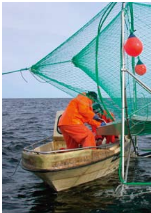
I moderna push up-fällor fångar man fisken levande. Vildlax

Ett annat problem är sjukdomen M74 som leder till att många yngel dör. Förra året hade 21 procent av den kompensationsodlade avkomman M74, enligt en undersökning av Fiskeriverket. Det är en ökning med fem procentenheter sedan år 2009 1 . Tidigare forskning har visat på ett samband