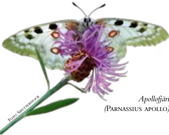
Apollofjäril ( PARNASSIUS APOLLO ).

Just nu är han aktuell som initiativtagare och ledare för Sveriges del vid uppbyggandet av ett europeiskt databasnätverk för biologisk mångfald kallat LifeWatch.