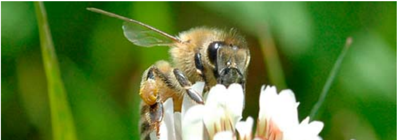
Honungsbi (APIS MELLIFLORA).